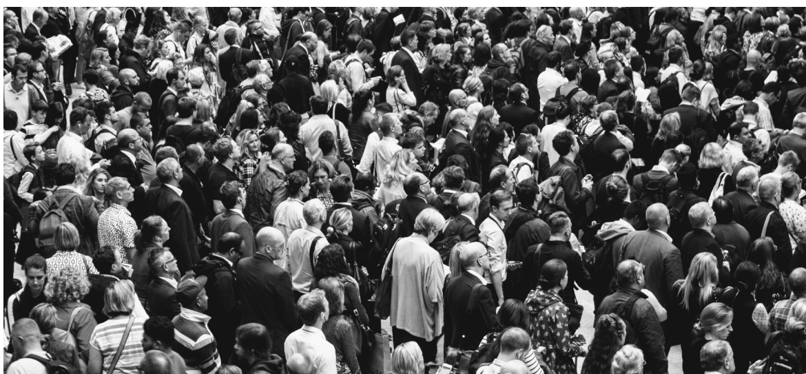
Abbildung 1

Diese Verunsicherungen – auf individueller wie auf gesellschaftlicher Ebene –, die durch gesellschaftliche Öffnung und Pluralisierung ausgelöst werden, gelten in der sozial- und politikwissenschaftlichen Forschung als ein Hintergrund, vor dem die mobilisierende Wirkung von extremistischen Narrativen auch jenseits der politischen Ränder der Gesellschaft zu verstehen ist. Mit ihrem ideologischen Angebot einer »nostalgische[n] Schließung gegenüber der kulturellen Modernisierung« (Merkel 2016, S.12) versprechen sie eine Gemeinschaft, die den oder die Einzelne*n von den Herausforderungen im Umgang mit Unterschieden und Konflikten entlastet.