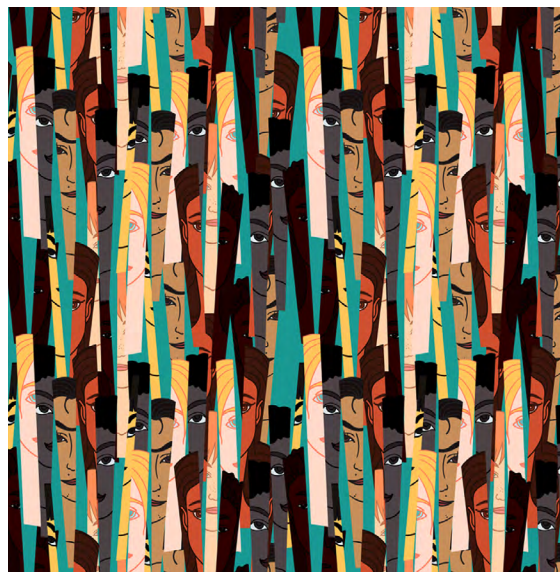
Abbildung 3 Die Relativität der eigenen Positionierung erkennen.