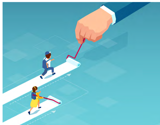
Abbildung 8 Schulerfolg kann von diskriminierenden Variablen wie Herkunft und Gender beeinflusst werden.

wird, insbesondere in Bezug auf Aufgaben, die eine komplexe Beurteilung erfordern, also mehr als nur das Auszählen von Fehlern beinhalten. Während der Unterschied bei Arbeiten, die einer Note 2 (gut) entsprechen noch gering ausfiel, war er besonders groß bei Arbeiten, die viele Fehler aufwiesen. Hier kam die Arbeit von Murat wesentlich schlechter weg als die von Max. Erhoben wurde in dieser Studie mit Lehramtsanwärter*innen. Es zeigen sich aber Effekte, die auch in Bezug auf die Schule berichtet werden.