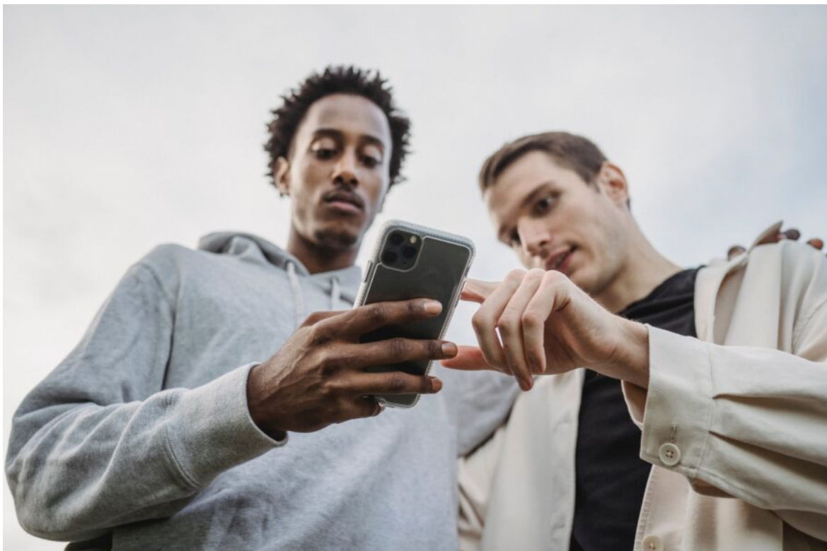
Abb. 1, Symbolbild

Medienpädagogik und politische Bildung im Gespräch über Gesellschaftskritik in und an sozialen Medien