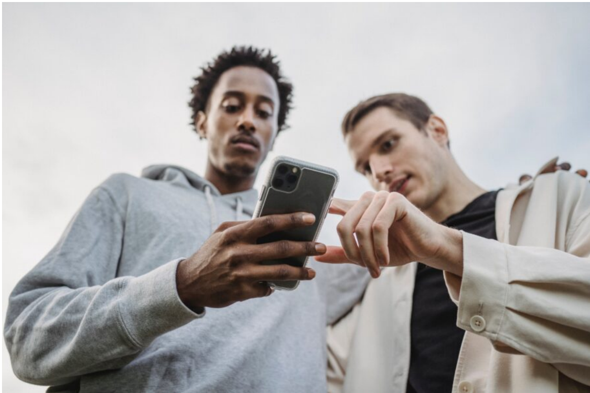
Abb. 1, Symbolbild

Medienpädagogik und politische Bildung im Gespräch über Gesellschaftskritik in und an sozialen Medien