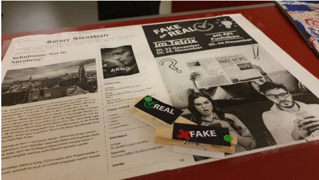
Abb. 2: Beispiel einer gefälschten Zeitungssseite mit lokalem Bezug zum Jugendzentrum.