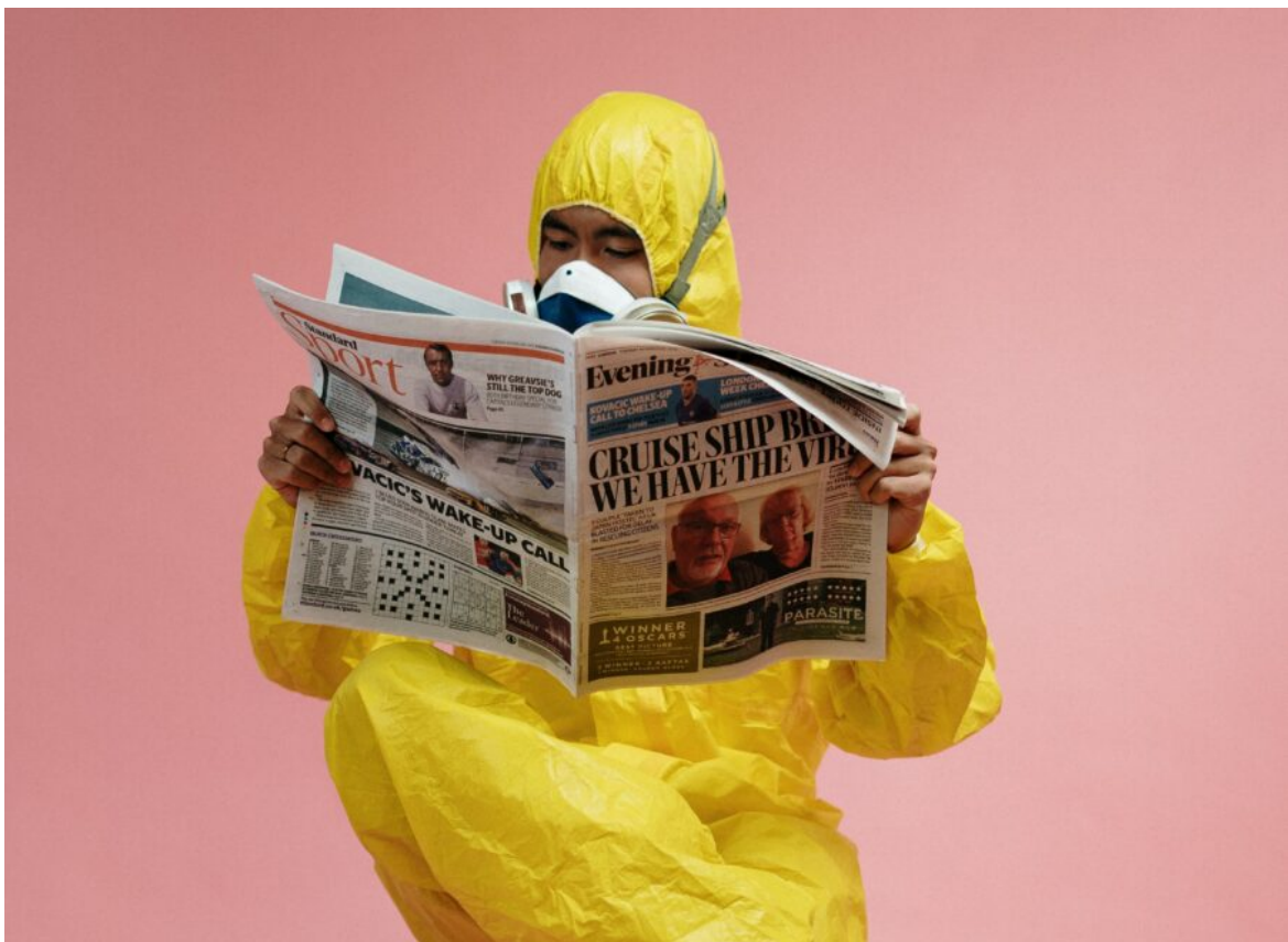
Abb. 1, Symbolfoto

Medienpädagogische Ansätze in der Arbeit gegen Desinformation