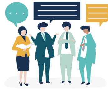
Abb. 6: Bewertungskriterien für Information gemeinsam mit anderen reflektieren.

Mit der eben beschriebenen Projektarbeit werden verschiedene Dimensionen von Medienkompetenz gefördert: die reflexiv-kritische in der Auseinandersetzung mit den eigenen Werten und denen des eigenen Umfelds sowie die soziale Dimension, wenn auch kontroverse, wertbezogene Aushandlungsprozesse verständigungsorientiert durchlaufen werden können (Digitales Deutschland 2020, S. 6).