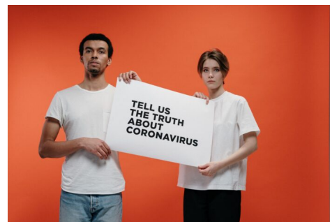
Abb. 2: Während der Coronapandemie war Orientierung für viele sehr herausfordernd.

„Ich finde, Fake News ist immer schwer zu sagen: ‚Okay, das ist jetzt falsch.‘ [Weil] in der Corona-Krise gibt es ja immer zwei verschiedene Seiten. Und wenn man googelt ‚okay, so und so ist es passiert‘, weiß man ja im Prinzip nicht, ob es wirklich so passiert ist, wenn man nicht haargenau dabei gewesen ist. [...] Aber wenn jemand anders mir das sagt, kann ja immer was dazu gedichtet sein oder nicht. Also kann ja auch bei einer ganz normalen oder bei einer guten Quelle, wie ARD zum Beispiel, wenn die News darüber bringen, kann’s ja auch mal – also klar recherchieren die und so, aber es kann ja auch mal falsch übertragen werden“ (E111, 47:54ff.).