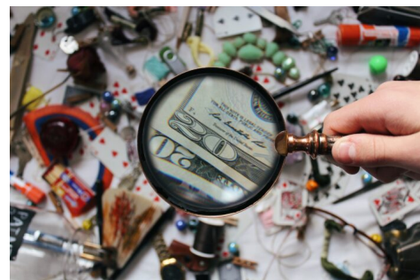
Abb. 4: Für Faktenchecks gibt es verschiedene Methoden.

In der medienpädagogischen Praxis spielen die großen politischen Themen – z. B.: Woher kam das Corona-Virus? – jedoch nur bedingt eine herausragende Rolle. Denn die großen Themen sind häufig derart umstritten und diffus, dass sie den Aufbau einer vertrauensvollen und offenen Kommunikation besonders für externe Fachkräfte erschweren. Um diese Schwierigkeiten zu verringern, haben wir im Projekt eine Methode entwickelt, die Faktencheck und Lebensweltorientierung miteinander kombiniert.