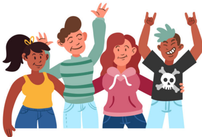
Abb. 3: Symbolbild Jugendliche.

Die Zielgruppe von Isso! sind Menschen zwischen 14 und 26 Jahren, die von außerschulischer Bildungsarbeit bisher nur schwer erreicht wurden. Die Arbeit im Projekt konzentriert sich in großen Teilen auf die Besucher*innen offener Formate in der Jugendarbeit.