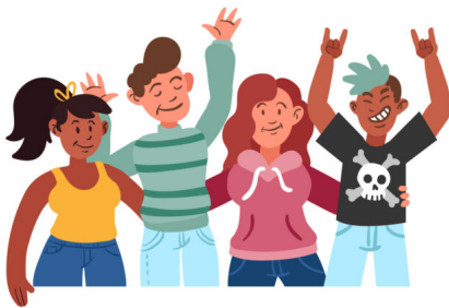
Abb. 3: Symbolbild Jugendliche.

Die Zielgruppe von Isso! sind Menschen zwischen 14 und 26 Jahren, die von außerschulischer Bildungsarbeit bisher nur schwer erreicht wurden. Die Arbeit im Projekt konzentriert sich in großen Teilen auf die Besucher*innen offener Formate in der Jugendarbeit.