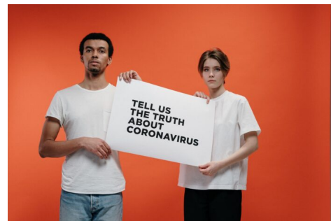
Abb. 2: Während der Coronapandemie war Orientierung für viele sehr herausfordernd.

„Ich finde, Fake News ist immer schwer zu sagen: ‚Okay, das ist jetzt falsch.‘ [Weil] in der Corona-Krise gibt es ja immer zwei verschiedene Seiten. Und wenn man googelt ‚okay, so und so ist es passiert‘, weiß man ja im Prinzip nicht, ob es wirklich so passiert ist, wenn man nicht haargenau dabei gewesen ist. [...] Aber wenn jemand anders mir das sagt, kann ja immer was dazu gedichtet sein oder nicht. Also kann ja auch bei einer ganz normalen oder bei einer guten Quelle, wie ARD zum Beispiel, wenn die News darüber bringen, kann’s ja auch mal – also klar recherchieren die und so, aber es kann ja auch mal falsch übertragen werden“ (E111, 47:54ff.).