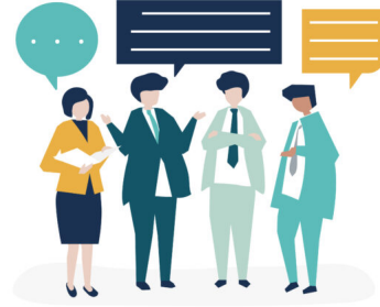
Abb. 6: Bewertungskriterien für Information gemeinsam mit anderen reflektieren.

Mit der eben beschriebenen Projektarbeit werden verschiedene Dimensionen von Medienkompetenz gefördert: die reflexiv-kritische in der Auseinandersetzung mit den eigenen Werten und denen des eigenen Umfelds sowie die soziale Dimension, wenn auch kontroverse, wertbezogene Aushandlungsprozesse verständigungsorientiert durchlaufen werden können (Digitales Deutschland 2020, S. 6).