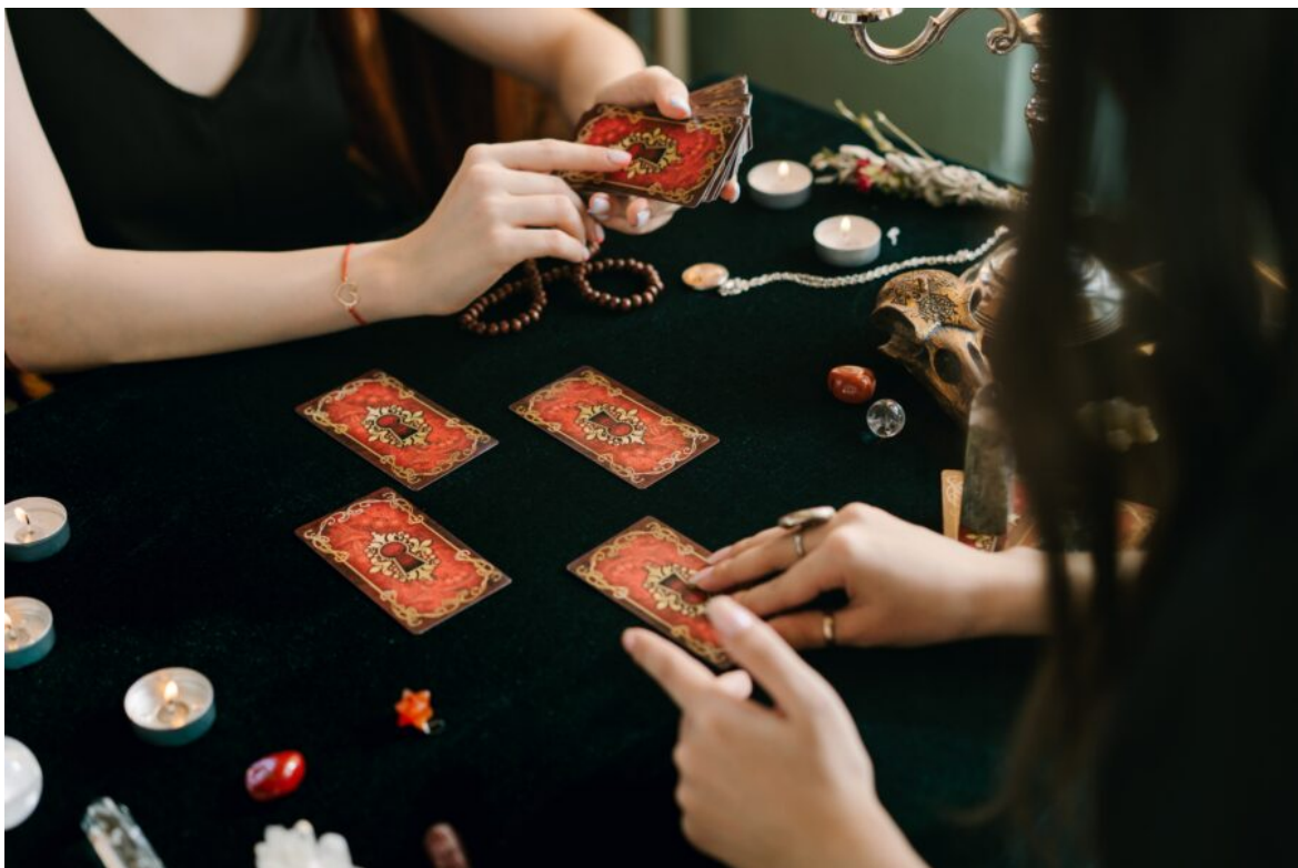
Abb. 1, Symbolbild Esoterik, Quelle: Pexels

Über Heilsteine, germanische Medizin und Verschwörungsmythen