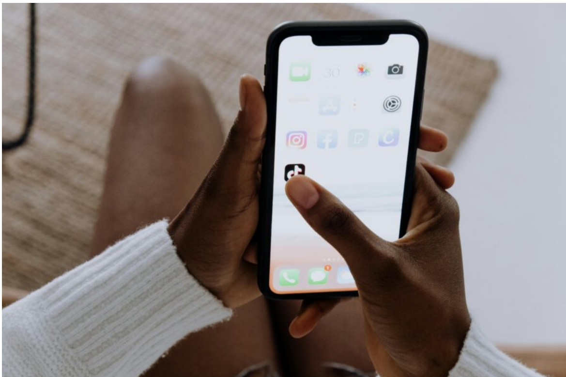
Abb. 1, Symbolbild Social Media

Zugegeben, die AfD macht das nicht schlecht. Sie verbreiten gekonnt ihre rechte Propaganda auf TikTok und ist darin besser als die andere Parteien. Und sie erreichen damit vor allem Jugendliche und junge Erwachsene. Aber viele wollen sich das nicht mehr gefallen lassen. Sie wollen social Media und vor allem TikTok nicht den rechten Aktivisten überlassen. Und deshalb heißt diese Folge „Reclaim the Web“. Die Jugendredaktion aus München schaut, was junge Aktivistinnen den Rechten auf TikTok entgegensetzen. Und sie probieren es selber aus und machen ein „Reclaim TikTok“-Video. Hört rein, was sie dabei erleben!