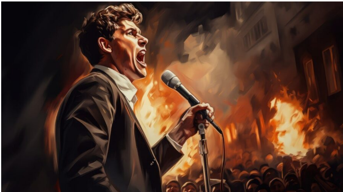
Abb. 1, Symbolbild

Sprache prägt unsere Wahrnehmung – das wissen auch rechtsextreme Akteur*innen. In dieser Folge schauen wir genauer hin: Welche Strategien stecken hinter Begriffen wie „Lügenpresse“ und „Genderwahn“? Wie schaffen es rechtsextreme Gruppen, Hass und Spaltung in harmlos wirkende Worte zu verpacken? Gemeinsam analysieren wir, wie diese manipulative Rhetorik unsere Sicht auf die Welt beeinflusst – und was wir dagegen tun können.