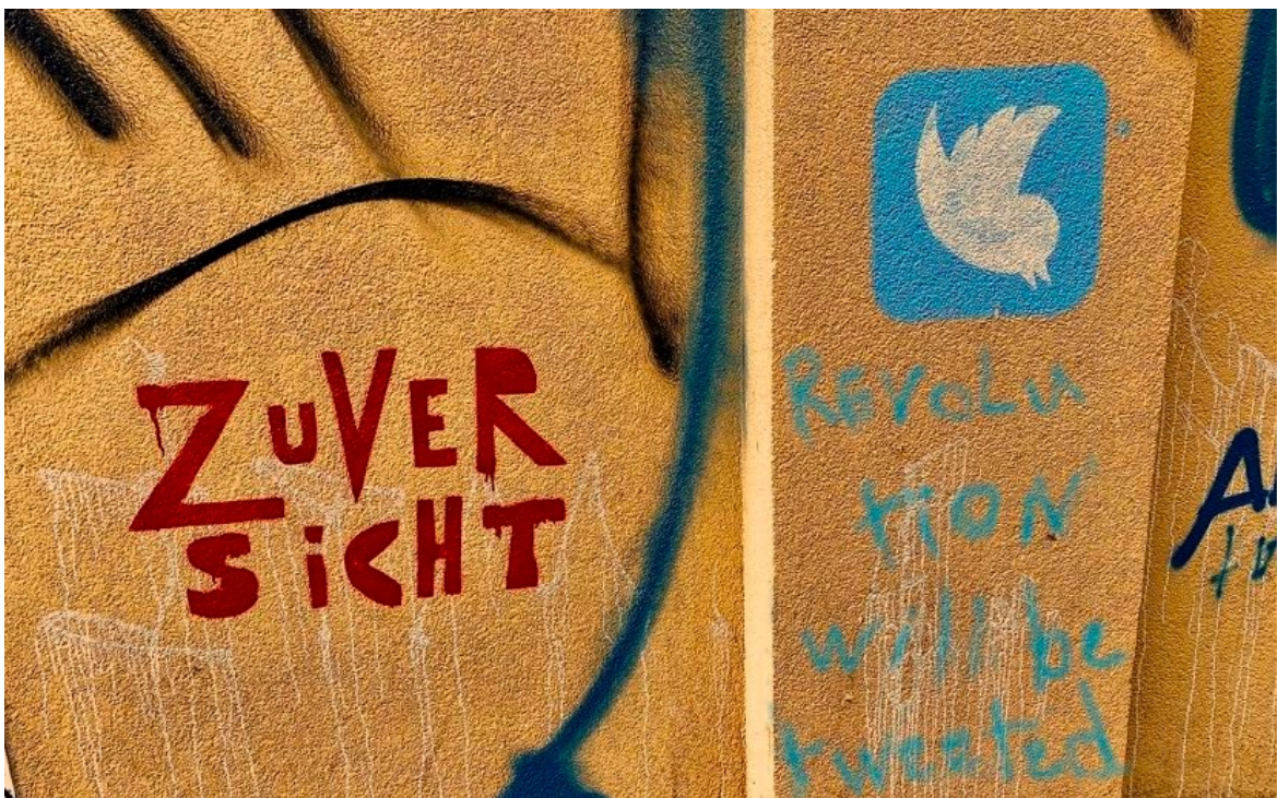
Graffiti am Rosenthaler Platz, Berlin.