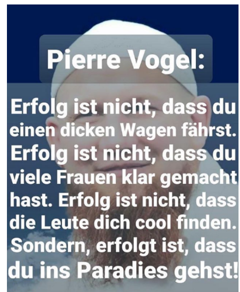
Abb. 4, An Ratgebern mangelt es nicht

Ein Beispiel dafür sind manche salafistische Gruppierungen. Diese behaupten von sich, den Islam so zu leben, wie es die Nachfolger des Propheten Mohammed taten. Sie stellen sich gegen individuelle Auslegungen der Schriften und Gebote des Islams. Extremistische salafistische Strömungen bekämpfen mitunter Abweichungen von dem Ideal, das sie als richtig bezeichnen, indem sie Andersgläubigen ihre Religion absprechen oder sogar Gewalt gegen sie ausüben. Ihre Positionen hören sich manchmal an, als ob sie aus einer anderen Zeit stammen. Dabei sind auch salafistische Gruppen tief in der Gegenwart verankert ( https://demokratie.jff.de/artikel/hizb-ut-tahrir-islamismus-als-dritter-weg/ ). Wer den Lebensweg heute bekannter Salafist*innen anschaut, sieht, dass dieser auch für sie sehr individuelle Herausforderungen enthalten hat. Ihre Lösung war es, sich zurückzuziehen und die Gegenwart abzulehnen. Ihr Versprechen ist es, dass alle, die es so machen wie sie – wohlgermerkt: nur so wie sie – die richtigen Wege an den Kreuzungen des Lebens nehmen.