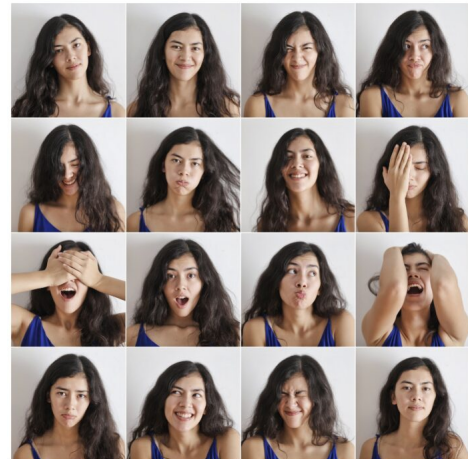
Abb. 3, Ich bin viele, viele sind ich

Ein weiterer Weg, nicht alleine man selbst sein zu müssen, sind religiöse Gemeinschaften. Das mag seltsam klingen, weil lange angenommen wurde, dass religiöse Gemeinschaften in individualisierten Gesellschaften an Bedeutung verlieren würden. Aber Religionen sind anpassungsfähig. So haben es beispielsweise buddhistische Gruppierungen, viele christliche Kirchen und muslimische Gemeinschaften geschafft, mit der Individualisierung ihrer Gläubigen umzugehen. Auch wenn sich nicht alle theologischen Inhalte verändert haben, wurden Wege gefunden, Angebote für sehr unterschiedliche Lebenswege zu bieten. Zum Beispiel wurden Scheidungen möglich gemacht, Rollenbilder von Mann und Frau ( https://demokratie.jff.de/artikel/gender-im-netz-zwischen-vielfalt-und-tradition/ ) flexibler oder religiöse Pflichten teilweise weniger verpflichtend.