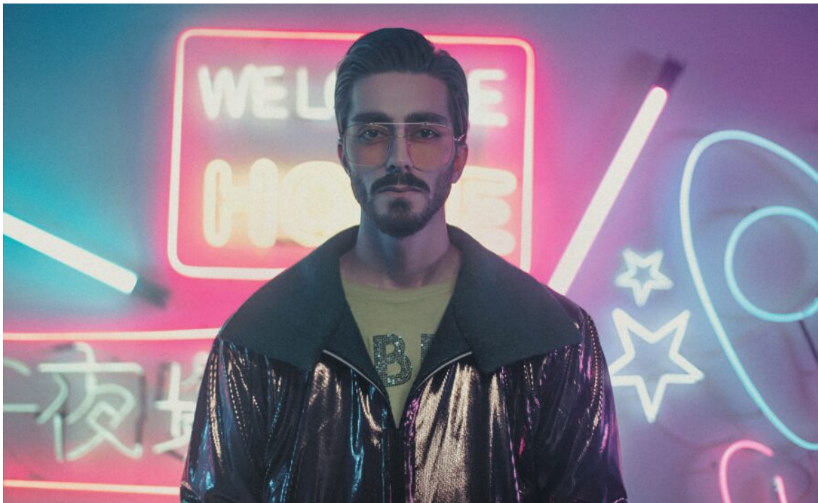
Abb. 1, Individuell vor Leuchtkreklame

Immer wieder muss man entscheiden, was einen ausmacht: Das iPhone? Der Schulabschluss? Oder doch der Glaube? Die richtige Version von sich selbst zu sein, das kann zu einer echten Herausforderung werden.