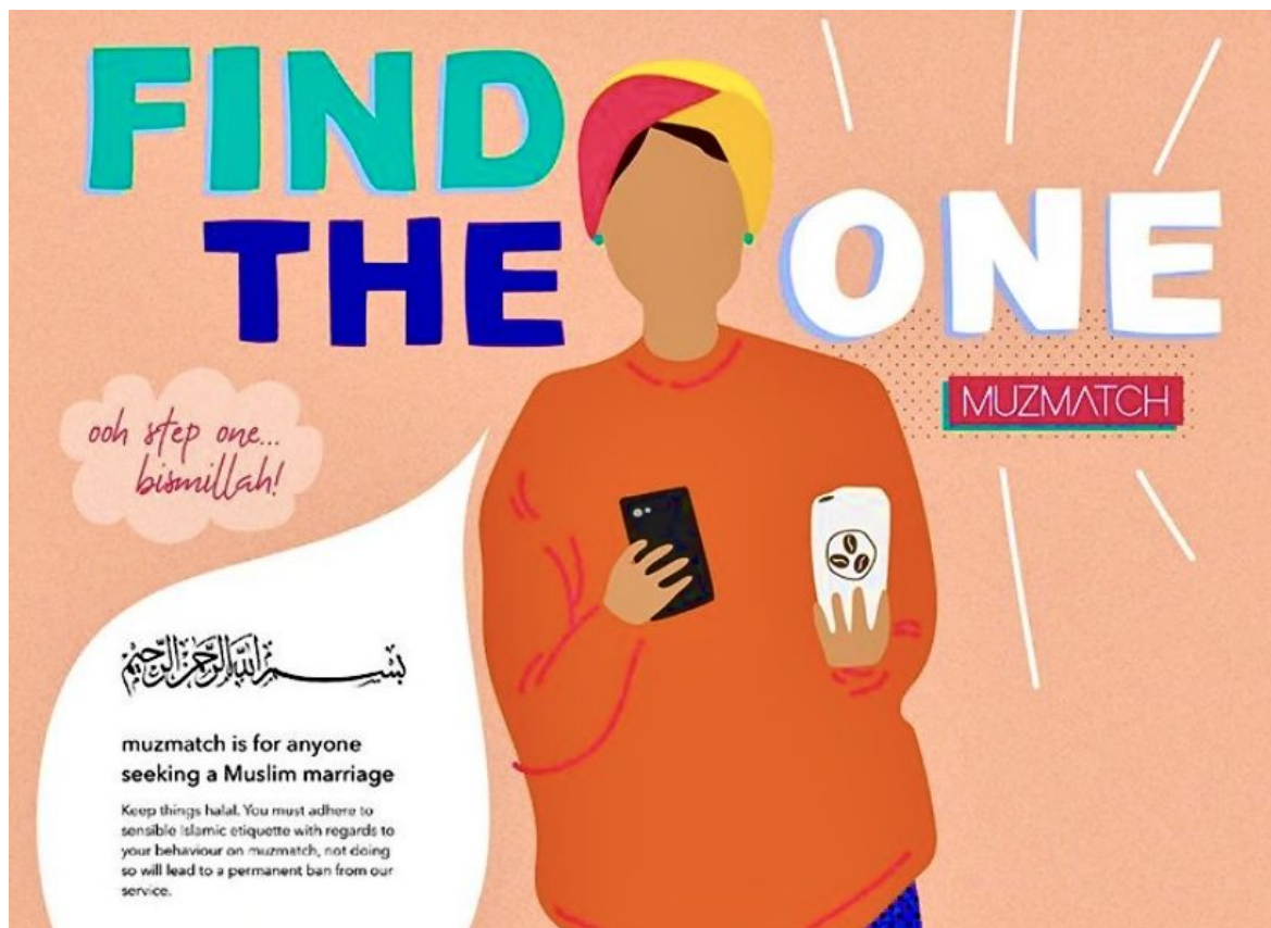
Abb. 1, Religion ist im Online-Dating angekommen

Religion ist im Online-Dating angekommen. Aber was macht sie da eigentlich?