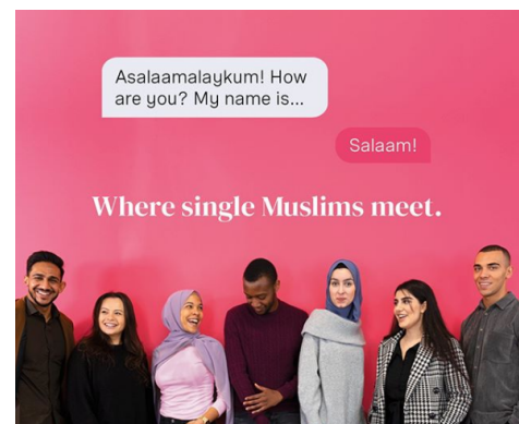
Abb. 4, Viele Muslim*innen verwenden Dating-Apps für eine selbstbestimmte Partnersuche

Trotzdem widersetzt sich die App sowohl dem traditionellen Matchmaking, das weitgehend von Eltern, Großfamilie oder der eigenen Community ( https://demokratie.jff.de/glossar/community/ ) bestimmt wird, als auch den gängigen Stereotypen, mit denen junge Muslim*innen in Deutschland immer wieder konfrontiert werden, wie Klischees der arrangierten Ehen, Zwangs- und Verwandtenheirat ( https://demokratie.jff.de/artikel/weiblich-feministisch-muslimisch/ ).