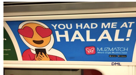
Abb. 3, Eine Werbekampagne von Muzmatch

Genau diese Breite muslimischer Religiositäten spiegelt sich in den Einstellungen von Muzmatch wider. Denn bei der Entwicklung der App wurden die unterschiedlichsten religiösen Identitäten junger Muslim*innen ( https://demokratie.jff.de/artikel/muslimische-identitaeten/ ) mitgedacht. So kann man bei der Erstellung des persönlichen Profils verschiedene Angaben zum eigenen religiösen Lifestyle machen wie z. B. Regelmäßigkeit des Betens, Grad der Religiosität oder das Essverhalten. Dazu bietet die App die Möglichkeit, einen sogenannten Wali (Vertrauensperson) einzuschalten, der jederzeit den Chatverlauf mitlesen kann.