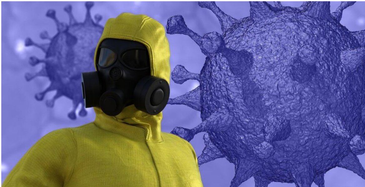
Abb. 1, Symbolbild für Coronakrise

Ein qualitativer Vergleich von Videos zur Coronakrise auf islamistischen und rechtspopulistischen YouTube-Kanälen