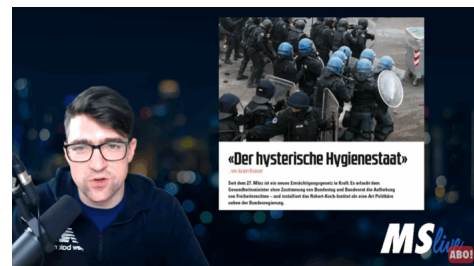
Abb. 4, Hygieneregeln als hysterisch und unrechtmäßig, Quelle: Martin Sellner live

Stattdessen werden alternative Expert*innen präsentiert, die angeblich näher an der – von vielen unerkannten – Wahrheit seien. Den Coronatests wird beispielsweise eine hohe Fehlerquote zugeschrieben und die Wirksamkeit der Hygienemaßnahmen bezweifelt oder sogar als hysterisch dargestellt (siehe Abb. 4). Auf Basis dieser Aussagen wird in den Videos Covid-19 als harmlos beschrieben und behauptet, die Epidemie sei schnell wieder vorbei. Verbreitet ist der Vergleich mit einer normalen Grippe.