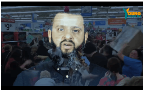
Abb. 2, Szenen eines Schlussverkaufes im Hintergrund visualisieren das Narrativ der Konsumkritik

Verbunden wird die Argumentation mit dem Aufruf, die Ausnahmesituation der Pandemie zur religiösen Bewährung zu nutzen. Dieses Motiv findet sich in vielen der analysierten Videos. Die Sprecher*innen adressieren die Unsicherheit der Menschen, um ihnen die religiösen Heilsversprechungen der islamistischen Gruppierungen nahezulegen. Ein weiteres Beispiel dafür ist das Video „#Coronavirus in Deutschland – Die pure Wahrheit“ auf dem Kanal Young Muslim . Im Video geht es über Kultur- und Konsumkritik (https://demokratie.jff.de/expertise/gesellschaftskritik/gesellschaftskritische-narrative/kapitalismus-und-globalisierungskritik/) hin zum Glauben daran, dass die Krise zur Bewährung genutzt werden solle (siehe Abb. 2).