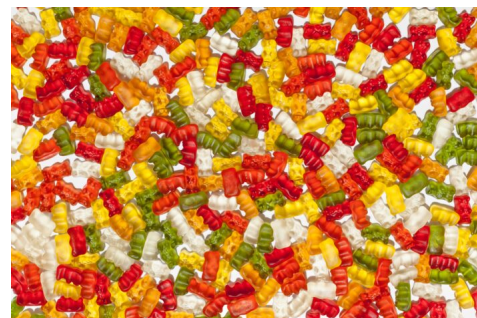
Abb. 3, Sind Forderungen nach Gummibärchen ohne Schweinegelatine bereits politischer Islam?

Noch konfuser wird es, wenn auf der anderen Seite das „Politische“ am „politischen Islam“ daran zu erkennen sein soll, wenn Kinder fasten, Frauen Kopftücher tragen, der Verzehr von Schweinegelatine in Gummibärchen oder der Handschlag gegenüber Frauen vermieden wird etc. Dieses beliebige Einengen beziehungsweise Ausweiten des Politikbegriffs kann nur „ideologisch“ plausibilisiert werden. Dem Begriffspaar „politischer Islam“ fehlt schlicht jede Trennschärfe. „Es wird ein Monster kreiert, das überall und nirgends ist“, so die Islamwissenschaftlerin Gudrun Krämer zum Leitanspruch der CSU aus dem Jahre 2016 zur Bekämpfung des „politischen Islam“. Mit guten Gründen hielt sie ein solches Vorgehen für einen schweren politischen Fehler. Diese Einschätzung ist überzeugend geblieben. Unter dem Begriff lässt sich alles subsumieren, was einem an muslimischen Lebenswelten anstößig erscheint.