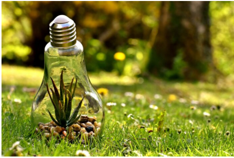
Abb. 4, Die Gläubigen sollen die Schöpfung schützen

Die Normfindung ist insoweit konsensfähig und nicht zwingend (aber auch) religiös. Für muslimische Gelehrte wie al-Amidi (gest. 1233) ergeben sich diese Einsichten „völlig losgelöst von Offenbarungsquellen, wie sie durch die Propheten vermittelt wurden“. Die Hauptfunktionen der islamischen Jurisprudenz sind unstreitig: 1. das Stärken des individuellen Verantwortungsbewusstseins über die Rolle des Menschen als Sachwalter auf Erden, 2. der Einsatz für Gerechtigkeit ( adl ) und Frieden ( salam ) gemessen am Pluralitätsgrad der Gesellschaft und schließlich 3. der Schöpfung nützlich ( maslaha ) zu sein und Schaden ( mafsada ) von ihr abzuwenden. Diese Aspekte sind religionswesentlich und politisch. Eine