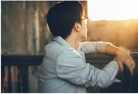
Abb. 2, Muslime geben sich Gott hin und nicht dem Islam.

Fast alle Muslim*innen in Deutschland leben verfassungskonform, einige wenige verhalten sich verfassungswidrig. Bei bekannten Rechtsverstößen werden sie wie alle anderen Bürger*innen juristisch belangt. Einige haben sich in rechtsfähige Vereine organisiert, andere nicht. Sie sind fehlbare Menschen – eine Selbstverständlichkeit, die sich im „Islamdiskurs“ aufzulösen scheint. Wir debattieren zu viel über Religionen, und noch mehr über den Islam, ohne wirklich klüger zu werden.