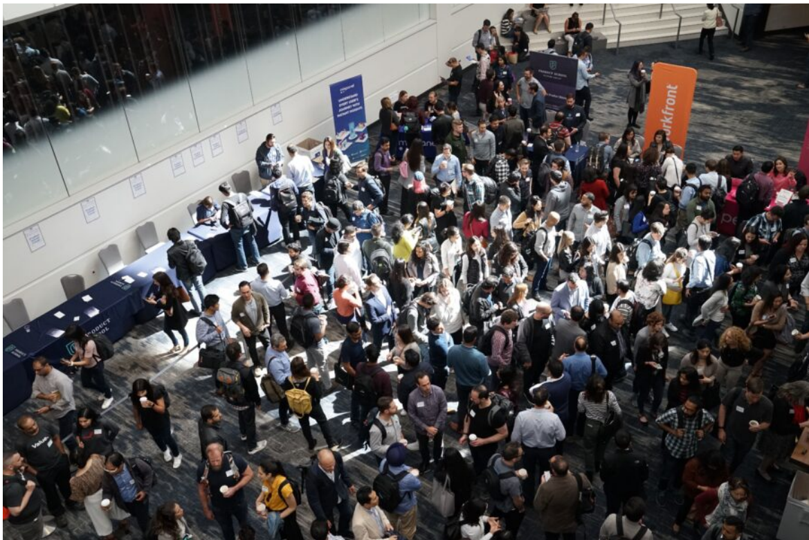
Abb. 1, Versammlung von Menschen

Plädoyer für anderen Diskurs über Religion und Politik