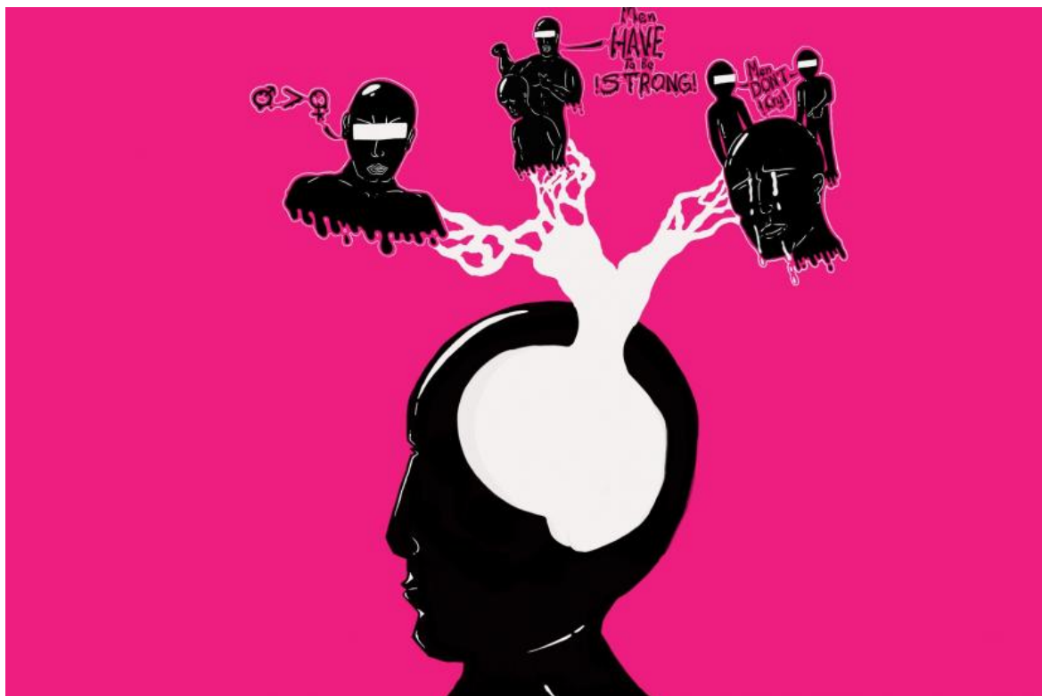
Abb. 1, Autoritäre Männlichkeitsentwürfe sind Bestandteile rechtsextremistischer und salafistischer Ideologien

Antifeminismus und Männlichkeitskult zwischen rechten und salafistischen Narrativen