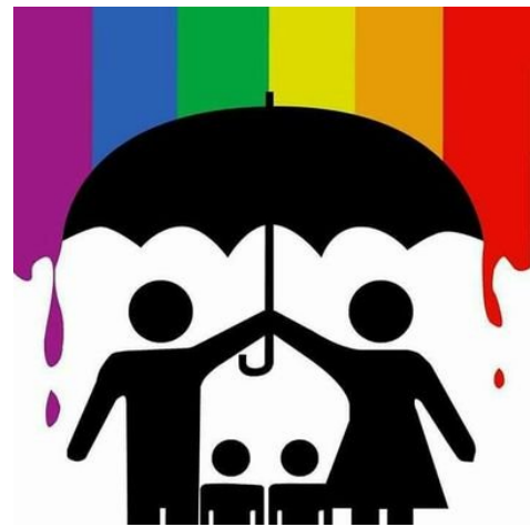
Abb. 5, Die Heteronormativität ist die Grundlage des ideologischen Familialismus

In diesem Narrativ entsteht ein Familienbild, das für die rechtsextreme familienpolitische Agenda besonders tragend ist und Familie als Symbol für den „Erhalt des eigenen Staatsvolks“ stilisiert (AfD 2017, S. 37). Auf diese Weise wird in rechtsextremen Diskursen das völkische Schreckgespenst des „Volkstodes“ zur Mobilisierung wiederbelebt. Grundlegend ist hierbei das Arrangement von familialischer und völkisch-rassi(sti)scher Rhetorik des angeblichen „Verschwinden[s] normaler Familien“ (AfD 2017, S. 37) oder, wie es Björn Höcke bei einer seiner Reden in Dresden ausgedrückt hat, das Bild eines Volkes, das durch „den Geburtenrückgang sowie Masseneinwanderung erstmals in seiner Existenz tatsächlich elementar bedroht“ wird. [7]