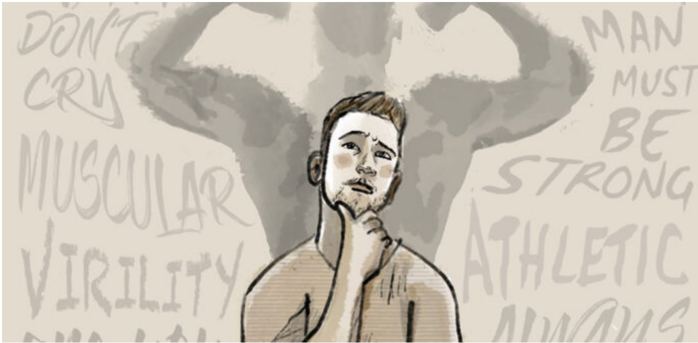
Abb. 4, Das Ideal eines hypermännlichen Heldentums spricht besonders junge Männer an, die nach geschlechtlichen Identitätsangeboten suchen Quelle (https://www.jeanmalgremoi.com/illustrations)

Vor diesem Hintergrund ist es notwendig, Verbindungen von gewalt- und autoritätsorientierten Männlichkeitsbildern und extremistischen Ideologien als möglichen Faktor für Radikalisierungsprozesse stärker in den Blick zu nehmen. [3] Sowohl rechtsextreme als auch salafistische Ideologien verbreiten das Ideal eines hypermännlichen Heldentums. Diese Überhöhung von Männlichkeitsbildern und der damit einhergehende Männlichkeitskult sind für die Attraktivität extremistischer Narrative von zentraler Bedeutung. Sie bieten (jungen) Männern die Möglichkeit, autoritäre Männlichkeitsentwürfe auszuleben – wozu auch die Ausübung von Gewalt gehört.