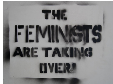
Abb. 4, Antifeministen stilisieren den Feminismus als männerfeindliches Projekt