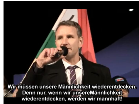
Abb. 2, Björn Höcke auf einer Parteiversammlung in Erfurt