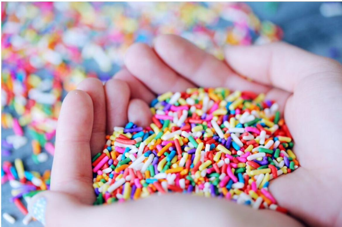
Abb. 1, Für Ali Ghandour ist muslimische Sexualethik pluralistisch

Ein Interview mit dem Islamtheologen Ali Ghandour