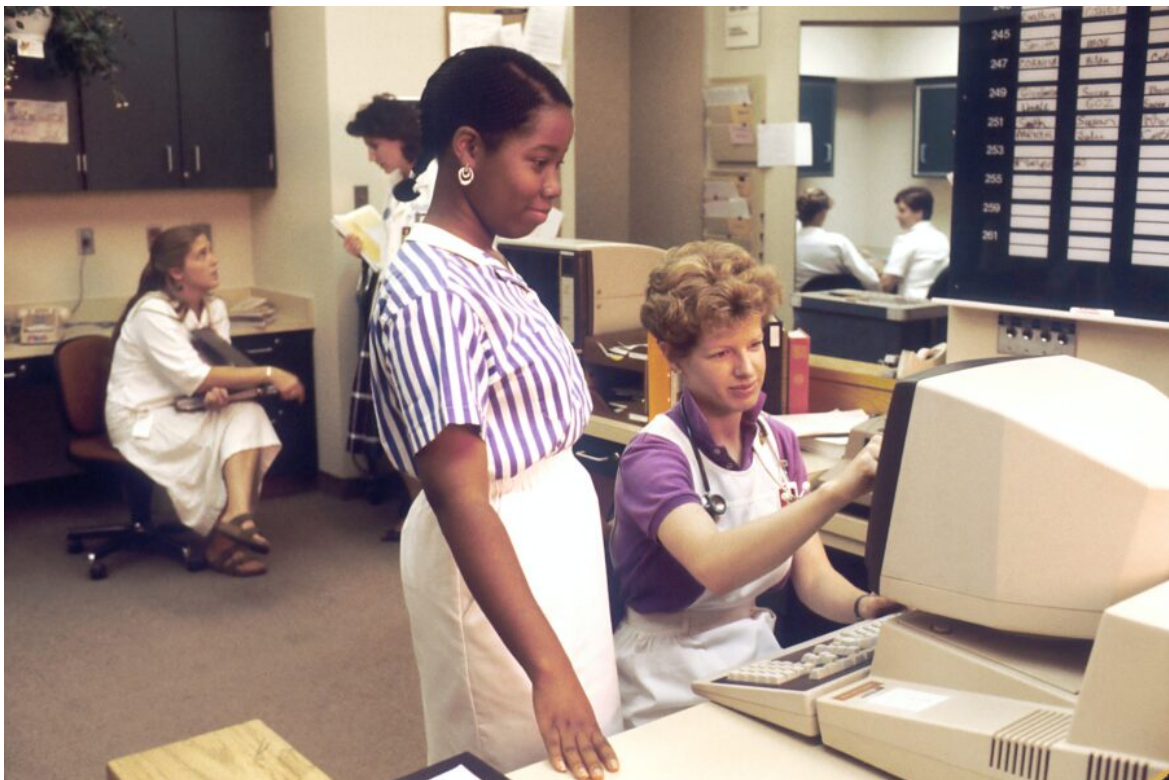
Abb. 1, Weiße Menschen sollten ihre gesellschaftliche Positionierung kritisch reflektieren

Weißsein ist eine gesellschaftliche Positionierung, die mit historisch überkommenden Privilegien einhergeht. Als weißer Mensch sein Weißsein zu reflektieren, kann helfen, sich differenziert mit rassistischen Strukturen auseinanderzusetzen und deren Einfluss zu verringern.