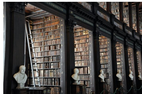
Abb. 3, Ein rassistuskritischer Blick auf den bildungsbürgerlichen Kanon

Zum anderen rückt der Ansatz des kritischen Weißseins die europäische Geistesgeschichte in ein neues Licht. Der Rassismus von Autoren wie Immanuel Kant und Georg W. F. Hegel wird kritisch diskutiert (Farr 2017; Piesche 2017b). Zentrale historische Bezugspunkte des weißen bürgerlichen Selbstverständnisses, wie Antike und Aufklärung, werden bezüglich rassistischer Strukturen hinterfragt (Broeck 2019; Paul 2019). Für weiße Bildungsbürger*innen ist das teilweise verstörend, in den meisten Fällen aber genau deswegen auch sehr gewinnbringend. Denn es hilft zu verstehen, warum Begriffe wie Chancengleichheit, Freiheit, Menschenrechte, menschliche Entwicklung oder auch Bildung aus der Perspektive von Nicht-Weißen anders gelesen und wesentlich kritischer betrachtet werden können.