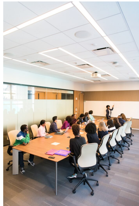
Abb. 2, Symbolfoto für einen akademischen Workshop

Das zweite Beispiel: Während Forschungsarbeiten im Senegal war bei meiner Schwarzen Gastfamilie vorübergehend der in Kanada studierende Sohn anwesend. Eines Nachmittags kam es im Hof des Hauses zu einer längeren Diskussion. Er machte mir gegenüber klar, dass ich als Weißer ein Profiteur des Kolonialismus und eines bis heute ungerechten Systems sei. Ich verwies auf die kurze Kolonialgeschichte Deutschlands, was inkorrekt war und was er zu Recht nicht gelten ließ. Er zählte mehrere kontroverse Beispiele dafür auf, wie die Leistungen Schwarzer Menschen bis in die Gegenwart falsch repräsentiert werden. Er brachte das Beispiel von Cheikh Anta Diop, einem bekannten senegalesischen Historiker, der rassistische Zuschreibung der etablierten Geschichtsschreibung radikal hinterfragte. Diop versuchte unter anderem nachzuweisen, dass die Erbauer*innen der ägyptischen Pyramiden schwarzer Hautfarbe gewesen seien und ihre Sklav*innen weiß. Über Ägypten kam mein Gesprächspartner auf Rassismus bei Johann G. Herder und Georg W. F. Hegel und viele andere Beispiele sowie letztlich sogar auf Jesus Christus, von dem er sagte, dass dieser – anders als er gemeinhin dargestellt werde – Schwarz gewesen sein müsse.