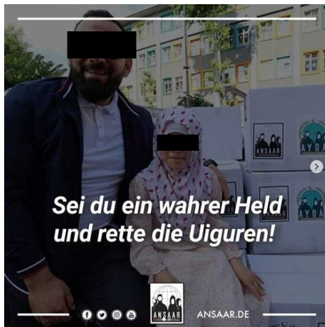
Abbildung 2: Wenn gute Absichten und problematische Positionen zusammenkommen.