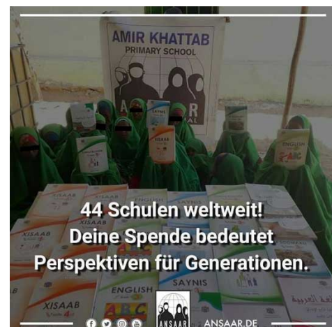
Abbildung 1: Islamistischer Spendenaufruf.

All dies gilt selbstverständlich auch für muslimische Jugendliche ( https://demokratie.jff.de/artikel/was-machen-junge-musliminnen-mit-online-informationen-zu-islamischen-themen/ ) und junge Erwachsene. In sozialen Netzwerken, in denen es auch um religiöse und herkunftsbezogene Themen geht, spielen beispielsweise die Verfolgungen und Vertreibungen von Muslim*innen in Myanmar, der Israel-Palästina-Konflikt oder der Krieg im Jemen eine große Rolle. Aktuell ist es vor allem die Unterdrückung von Muslim*innen