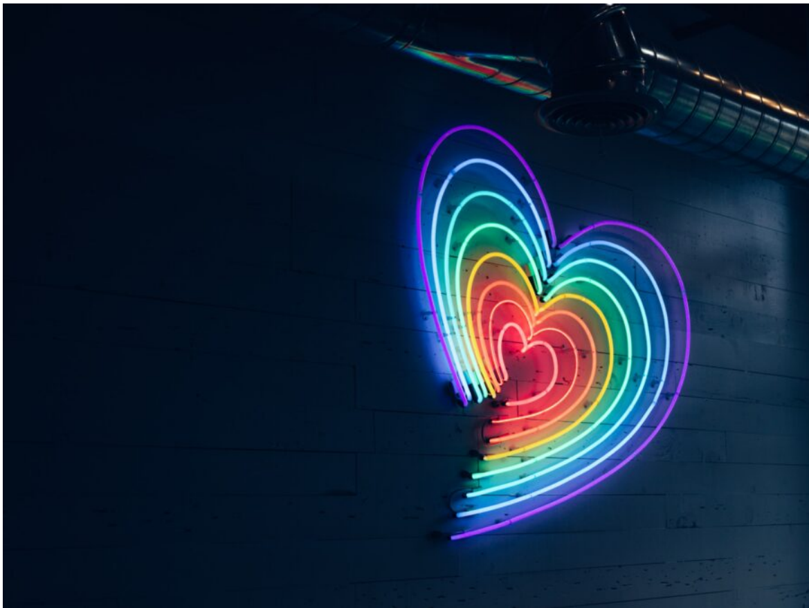
Abb. 1, Wie halten es junge Muslim*innen mit der Liebe?

Das haben wir vier junge Muslim*innen gefragt