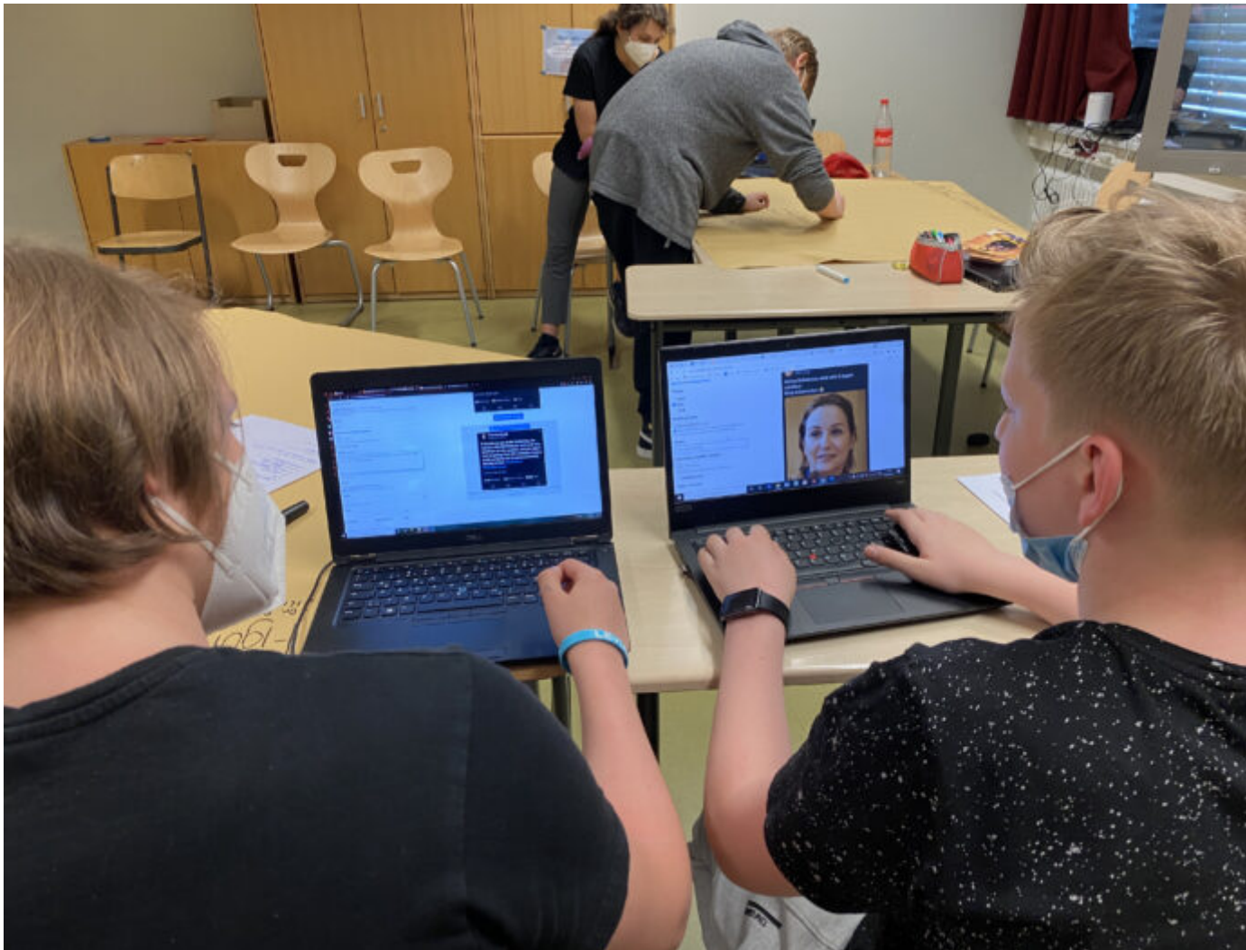
Abb. 3, Aufnahme aus einem Workshop im Projekt „TruthTellers“

zu liefern. Somit wird die Beweislast, dass es sich um keine Verschwörung handelt, an die Gesprächspartner*innen zurückgegeben (Skudlarek 2020).