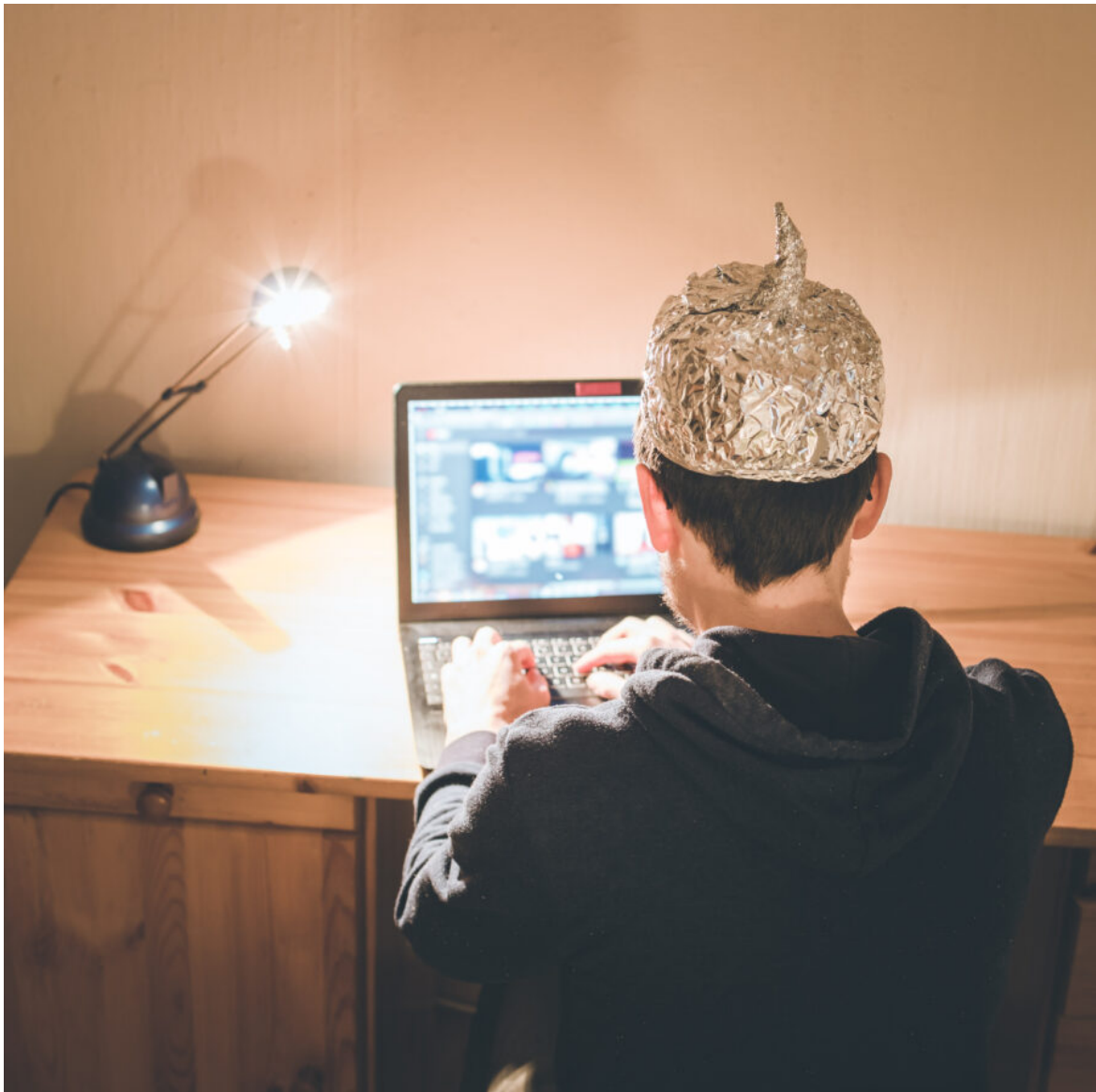
Abb. 1, Verschwörungserzählungen und soziale Medien

Verschwörungserzählungen und soziale Medien