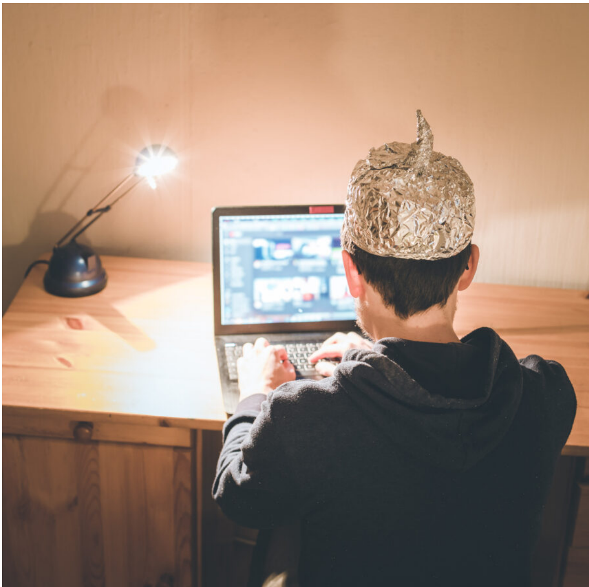
Abb. 1, Verschwörungserzählungen und soziale Medien

Verschwörungserzählungen und soziale Medien