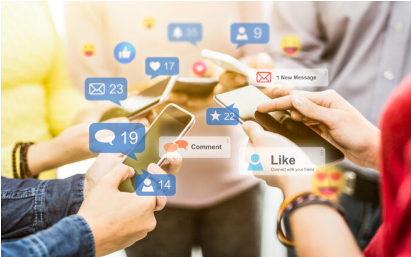
Abb. 2, Soziale Medien als digitaler Sozialraum

Funktion ihrer Angebote, die in den letzten Jahren zunehmend zu wichtigen Faktoren der öffentlichen, politischen Auseinandersetzung geworden sind.