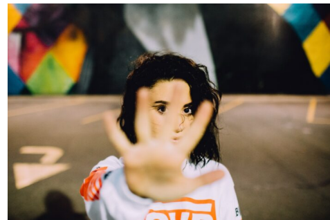
Abb. 3, Politische Bildung soll Gesellschaften nicht kategorisieren

Wir danken der Jugendbildungsstätte Kaubstraße und politischbilden.de ( https://politischbilden.de/ ) für die Genehmigung zur Veröffentlichung des Textes. Die Berliner Jugendbildungsstätte Kaubstraße bietet für junge Menschen Seminare zu verschiedenen Themen der politischen Bildung an. Angeboten werden unter anderem Kurse zu den Themen Diversity, Feindlichkeit gegen Sinti und Roma und Methoden zur Förderung sozialer Kompetenzen. Hier ( https://www.kaubstrasse.de/index.php ) geht es zu weiteren Informationen zu der JBS!