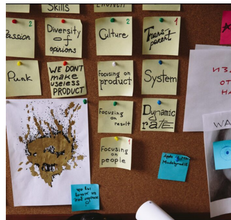
Abb. 2, Politische Bildung benötigt eine kritische Herangehensweise

Menschen zu empowern, muss mit ihren Inhalten und Formaten die Voraussetzungen dafür schaffen, dass Menschen fundierte Meinungen und Positionen entwickeln können. Dafür braucht es Wissen und Sensibilität über und für historische und aktuelle gesellschaftliche und politische Prozesse und Entscheidungen. Es braucht historische und aktuelle Kenntnisse über lokale und globale Strukturen und Machtverhältnisse und es braucht die unterschiedlichen Perspektiven und Positionen der an den Prozessen Beteiligten, damit nicht nur auf Narrativen der eigenen Perspektiven Positionen entwickelt werden.