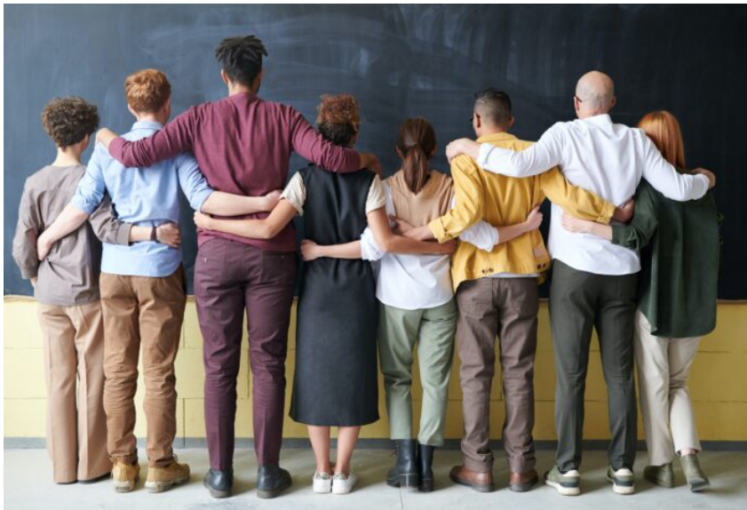
Abb. 3, Diversität als Normalität

Statt davon auszugehen, dass Flucht und Migration erst durch die Anwesenheit kürzlich geflüchteter Menschen relevante Themen der Auseinandersetzung werden, muss eingesehen werden, dass verschiedene Bezüge dazu schon längst Normalität sind.