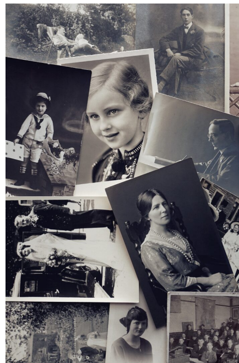
Abb. 2, Historische Bezüge als Familiengeschichte

Dass für Anne Franks Familie Deutschland ein unsicherer Ort war, den sie verlassen musste, regt zu einem Perspektivwechsel an: In zeitgenössischen Diskursen kommt Deutschland in der Regel als – großzügiges oder schützenswertes – Aufnahmeland daher. Wer sich zu Deutschland zugehörig fühlt, kommt in diesem Diskurs eher selten auf die Idee, sich selbst in die Lage zu versetzen, darauf angewiesen zu sein, in einem anderen Land Sicherheit zu finden. Bei dieser Verknüpfung soll es nicht darum gehen, die Kontexte gleichzusetzen. Der deutsche Antisemitismus trieb Anne Franks Familie zunächst dazu, Deutschland zu verlassen, und zwang sie später, nach Mitteln und Wegen zu suchen, aus den Niederlanden zu fliehen – erfolglos. Dies ist nicht gleichzusetzen mit den Zwängen und Wünschen, die Havas Familie dazu veranlassten, den Kosovo zu verlassen, oder Marah aus Syrien nach Deutschland trieben. Deshalb geht das Lernmaterial nicht nur auf die Gemeinsamkeiten der drei Biografien ein, sondern stellt auch deren Unterschiede heraus. Auch die Unterschiede in den Lebensgeschichten von Hava und Marah werden dabei thematisiert, sodass diese nicht als Repräsentantinnen für Geflüchtete heute