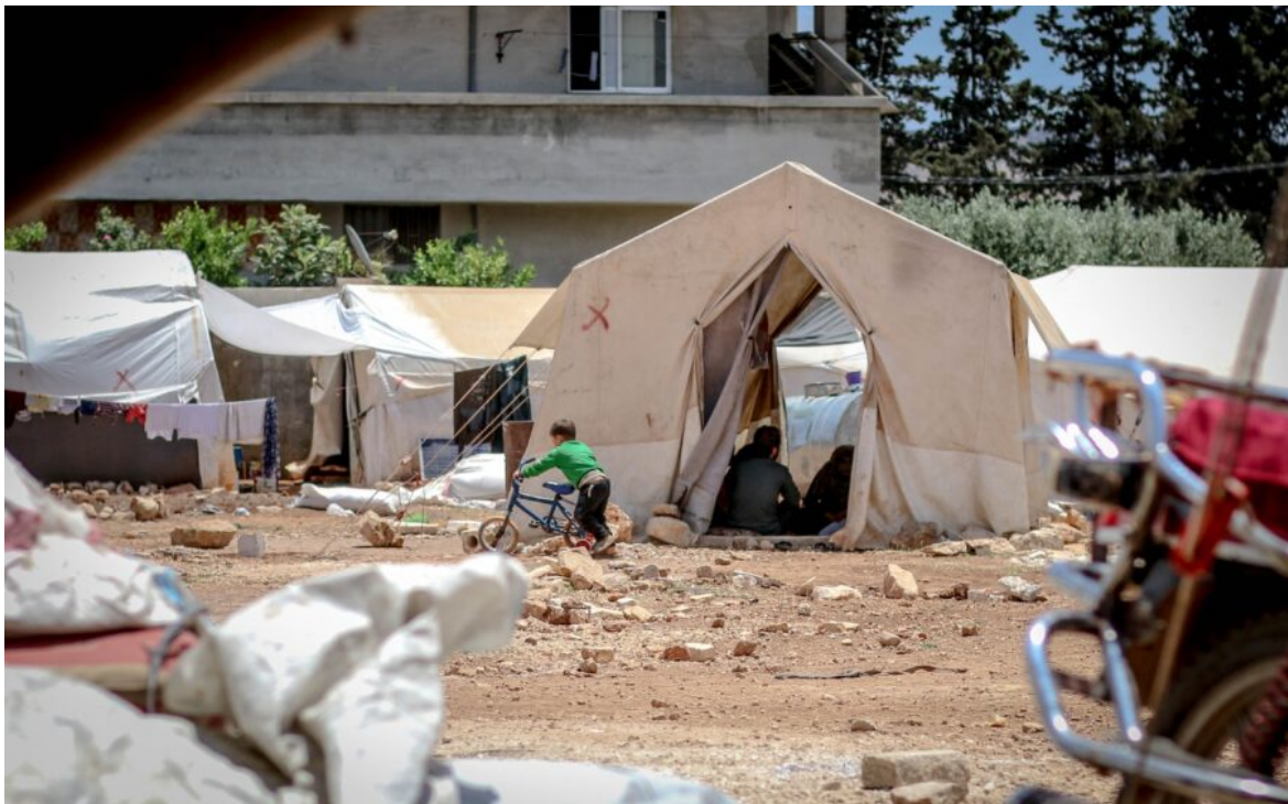
Abb. 1, Symbolbild für Flucht

Möglichkeiten der Bildung gegen Rassismus und Antisemitismus