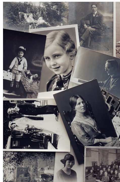
Abb. 2, Historische Bezüge als Familiengeschichte

Dass für Anne Franks Familie Deutschland ein unsicherer Ort war, den sie verlassen musste, regt zu einem Perspektivwechsel an: In zeitgenössischen Diskursen kommt Deutschland in der Regel als – großzügiges oder schützenswertes – Aufnahmeland daher. Wer sich zu Deutschland zugehörig fühlt, kommt in diesem Diskurs eher selten auf die Idee, sich selbst in die Lage zu versetzen, darauf angewiesen zu sein, in einem anderen Land Sicherheit zu finden. Bei dieser Verknüpfung soll es nicht darum gehen, die Kontexte gleichzusetzen. Der deutsche Antisemitismus trieb Anne Franks Familie zunächst dazu, Deutschland zu verlassen, und zwang sie später, nach Mitteln und Wegen zu suchen, aus den Niederlanden zu fliehen – erfolglos. Dies ist nicht gleichzusetzen mit den Zwängen und Wünschen, die Havas Familie dazu veranlassten, den Kosovo zu verlassen, oder Marah aus Syrien nach Deutschland trieben. Deshalb geht das Lernmaterial nicht nur auf die Gemeinsamkeiten der drei Biografien ein, sondern stellt auch deren Unterschiede heraus. Auch die Unterschiede in den Lebensgeschichten von Hava und Marah werden dabei thematisiert, sodass diese nicht als Repräsentantinnen für Geflüchtete heute