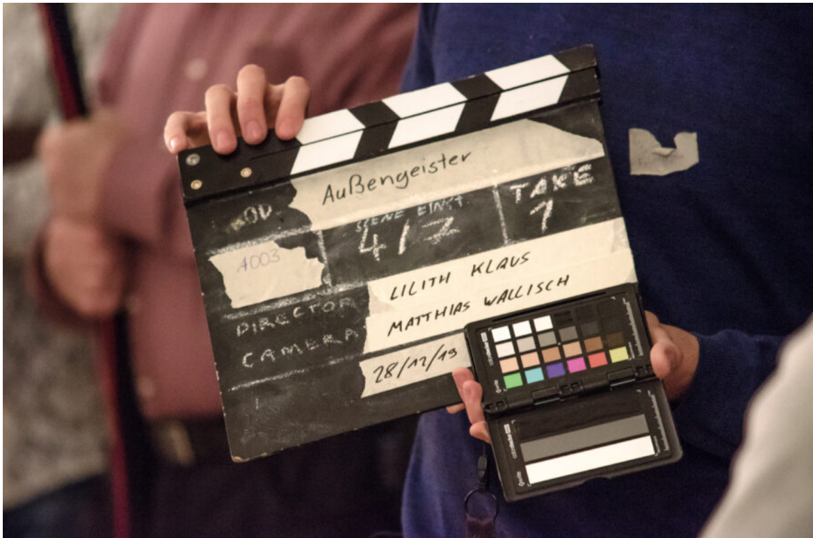
Abb. 1, Am Set von "Außengeister". Eine Produktion gefördert von RISE.

Erfahrungen aus dem Projekt RISE – Jugendkulturelle Antworten auf islamistischen Extremismus