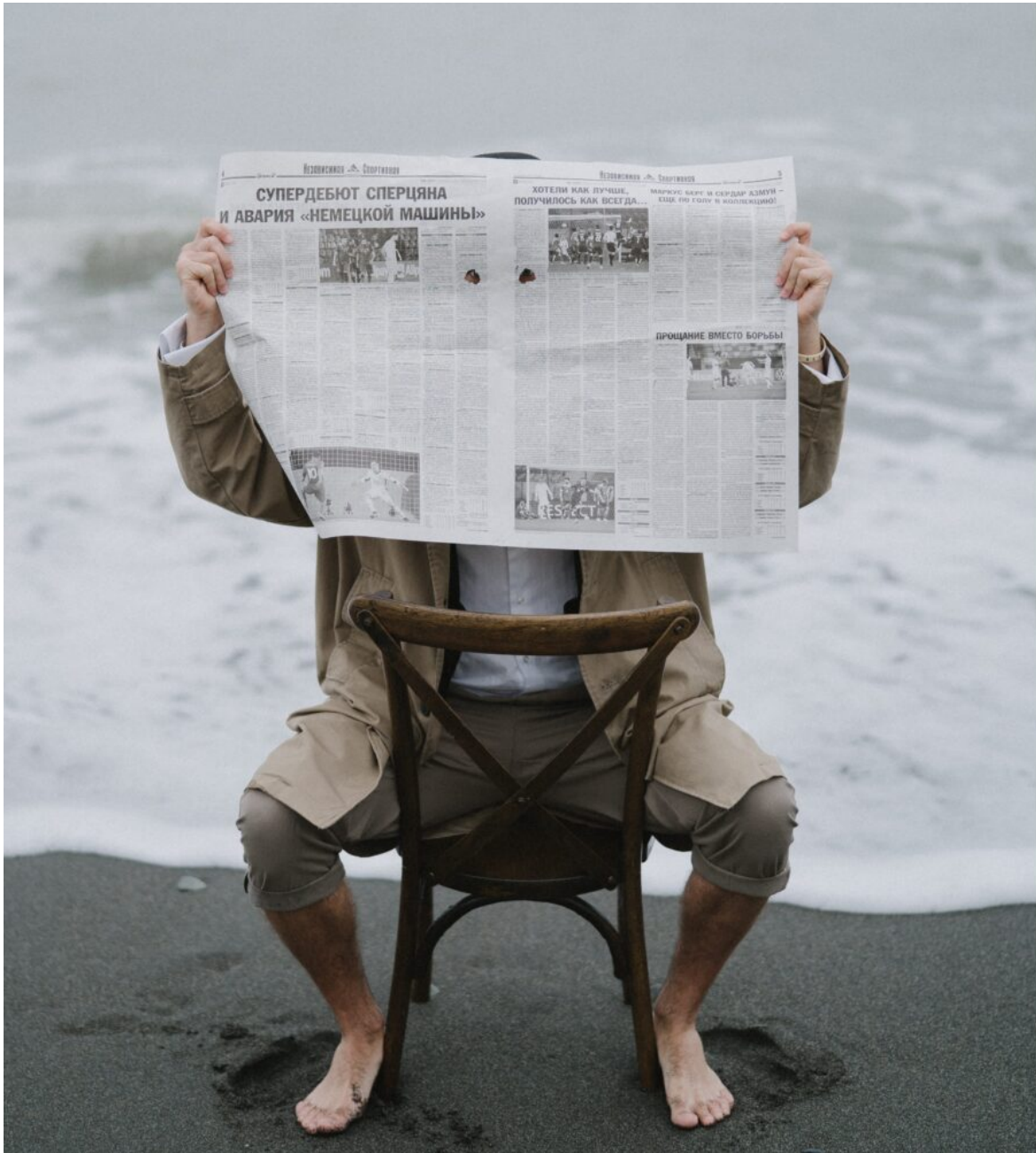
Abb. 1: Journalist*innen sind nicht nur Beobachter der gesellschaftlichen Realität

Journalist*innen und Medienhäuser haben in den letzten Jahren ein gesteigertes Bewusstsein für Rassismus und Diskriminierung entwickelt. Aber die Migrationsberichterstattung und Talkshows wie „Die letzte Instanz“ zeigen, dass die Berichterstattung immer noch an vielen Stellen diskriminierend ist.