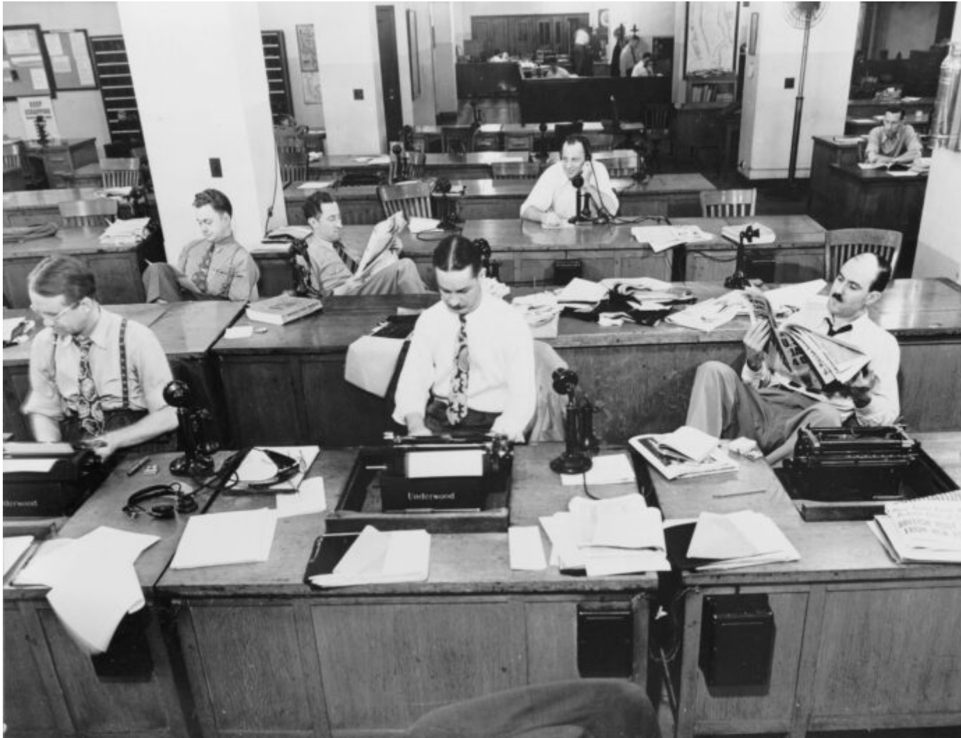
Abb. 2: Auch heute bestehen Redaktionen noch mehrheitlich aus weißen Männern.