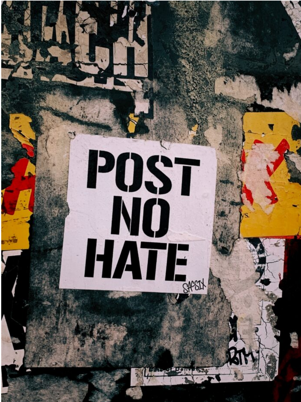
Abb. 3: Eine „kommunikative Ethik“ zu erlernen ist eine gesamtgesellschaftliche Aufgabe.

Und welche Systemzwänge bleiben eventuell trotz Bemühungen?