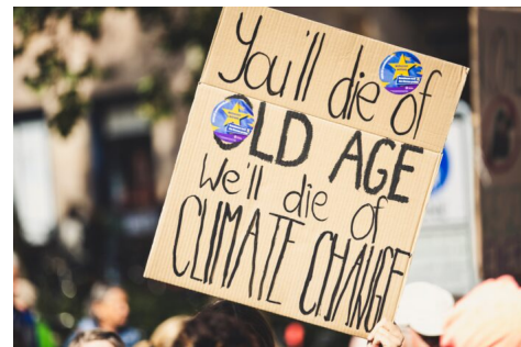
Abb. 4: Jüngere Generationen stellen neue Forderungen

Das könnte bedeuten, sowohl ältere westliche Traditionen wie die republikanische oder die radikaldemokratische – siehe u.a. Aristoteles' ?????????? und ?????????????? – als auch nicht westliche Traditionen, die nicht durch die liberale Modernität kolonisiert wurden – siehe Bruno Latour –, gedanklich einzubeziehen. Das steht in direktem Bezug zu Ihrer Fragestellung nach „internationalem“ bzw. interkulturellem Austausch. Und deshalb ist es so spannend, mit jungen Menschen, also den jüngeren Generationen zu arbeiten, weil diese häufig die Abkehr von schon beschrittenen Pfaden einfordern und uns vorwerfen, dass wir zu alt und zu konservativ sind.