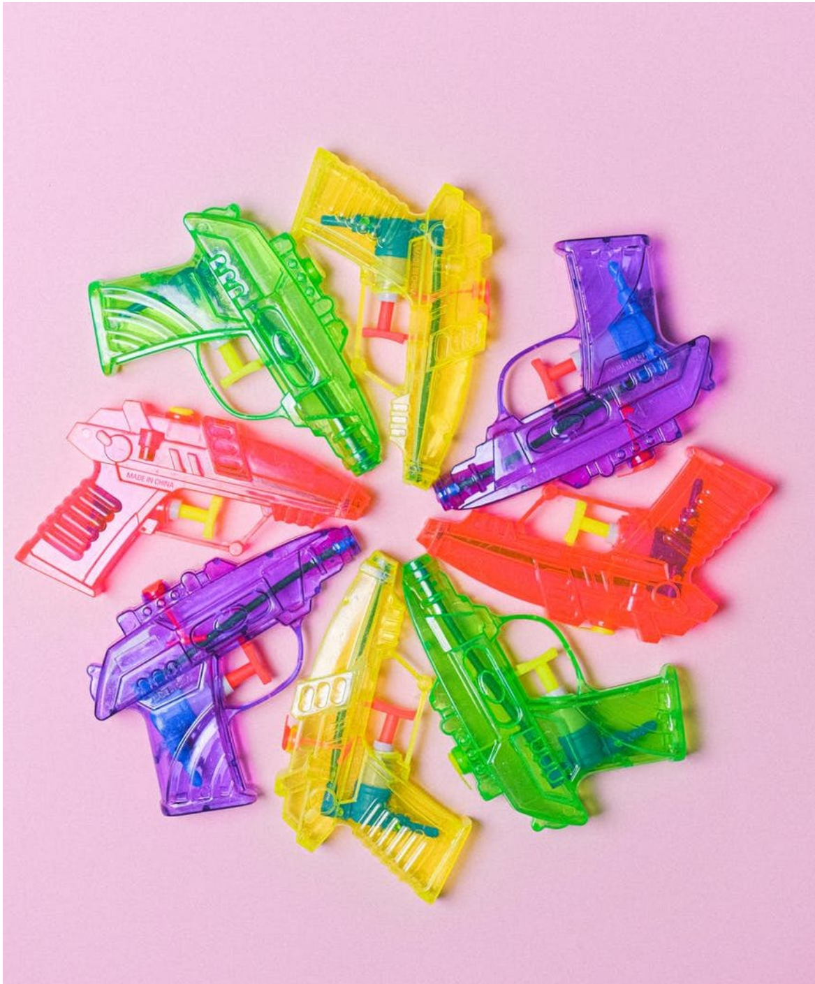
Abb. 1.: Konflikte sind unvermeidlich in einer pluralistischen Gesellschaft.

Die Subjektorientierung ist ein zentrales Prinzip der politischen Bildungsarbeit: Schüler*innen sollen lernen, ihre politischen Anliegen zu artikulieren und einzubringen. Die Politikdidaktikerin Claire Moulins-Doos sieht das kritisch. Sie argumentiert, dass dadurch das Gemeinwohl aus dem