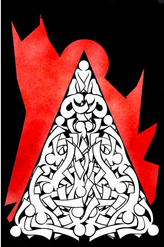
Abb. 2: „Toleranz ist hierarchisch“ (Moulin-Doos)

Ich selbst sehe mich mit diesem Verständnis in einer radikal-demokratischen Tradition, in der der Konflikt der Kern des Politischen ist und damit etwas Positives und Konstruktives ist, um überhaupt erst zusammenzukommen: „Ich erkenne dich als Teil eines politischen Wirs an, wir leben zusammen. Ich nehme dich und deine Ideen ernst und deshalb kann ich mit dir in einen zivilen Konflikt eintreten.“ Dabei geht es nicht um Toleranz. Toleranz ist hierarchisch, jemand toleriert einen anderen, der als passiver Rezipient dieser Toleranz gilt. Mir geht es um Respekt als Grundlage dieses Zusammenlebens, also um etwas Horizontales: Wenn ich jemanden respektiere, erkenne ich ihn und seine Ideen an und bin bereit, mit ihm über Ideen, Präferenzen, Meinungen und Werte zu diskutieren und darüber zu streiten.