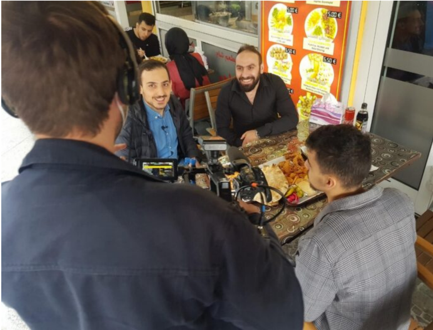
Abb. 8: In der Videoserie „Kiez:Kulinarik“ zeigen Jugendliche den Teamenden ihre kulinarischen Geheimtipps und führen Interviews mit den Geschäftstreibenden. Dabei geht es dann nicht nur ums Essen.

Im Rahmen des bereits umgesetzten Videoprojekts „Meine Story“, das ebenfalls durch die Nguy?n-Schwestern begleitet wurde, konnten erste erfolgreiche Erfahrungen mit fünf Berliner Jugendlichen gemacht werden. Durch einen Workshop zu Interviewtechniken und Hintergrundinformationen zu biografischen Narrativen wurden sie mit den nötigen Kompetenzen ausgestattet. Mit diesem Wissen haben die Jugendlichen dann selbstständig im familiären Umfeld Interviews mit Eltern, Onkeln oder Großeltern durchgeführt. Diese wurden fotografisch, filmisch und mit Audioaufnahmen dokumentiert und in einer anschließenden Kurzvideoproduktion umgesetzt. Zwei Ebenen konnten dadurch besondere Wertschätzung erfahren: das Mitteilungsbedürfnis der älteren Generationen auf der einen Seite und die bei den Jugendlichen angestoßenen Lernprozesse und Reflexionen auf der anderen Seite. Dabei können solche Projekte auch ohne teure technische Ausstattung umgesetzt werden. Heutzutage besitzt praktisch jedes Smartphone eine Kamera und ein Aufnahmegerät, die eine solide Dokumentation ermöglichen. Im Vordergrund steht aber ohnehin das Anstoßen eines autobiografischen Reflexionsprozesses.