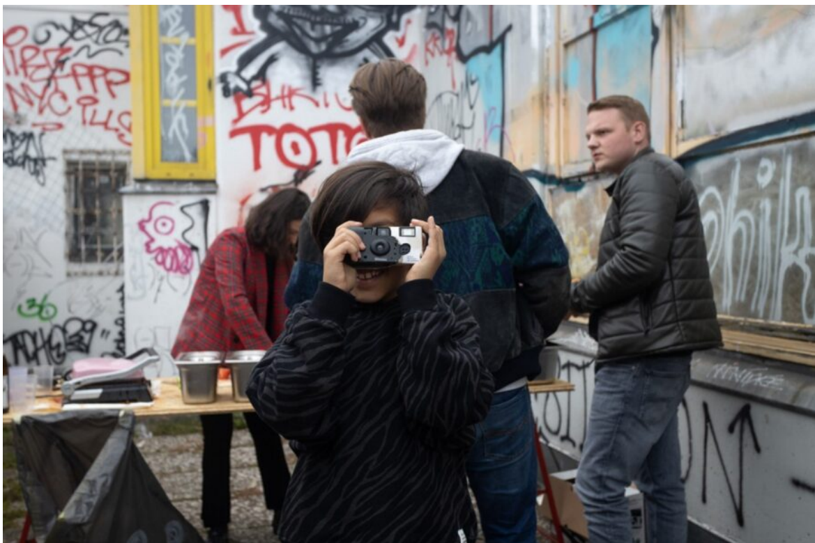
Abb. 1: Eine junge Fotografin dokumentiert die kiez:story-Ausstellung in Kreuzberg. Für die Schul-AGs ist sie aber noch ein wenig zu jung, diese richten sich an 14- bis 18-Jährige.

Multiperspektivische Dokumentationsarbeit von Jugendlichen im Modellprojekt kiez:story