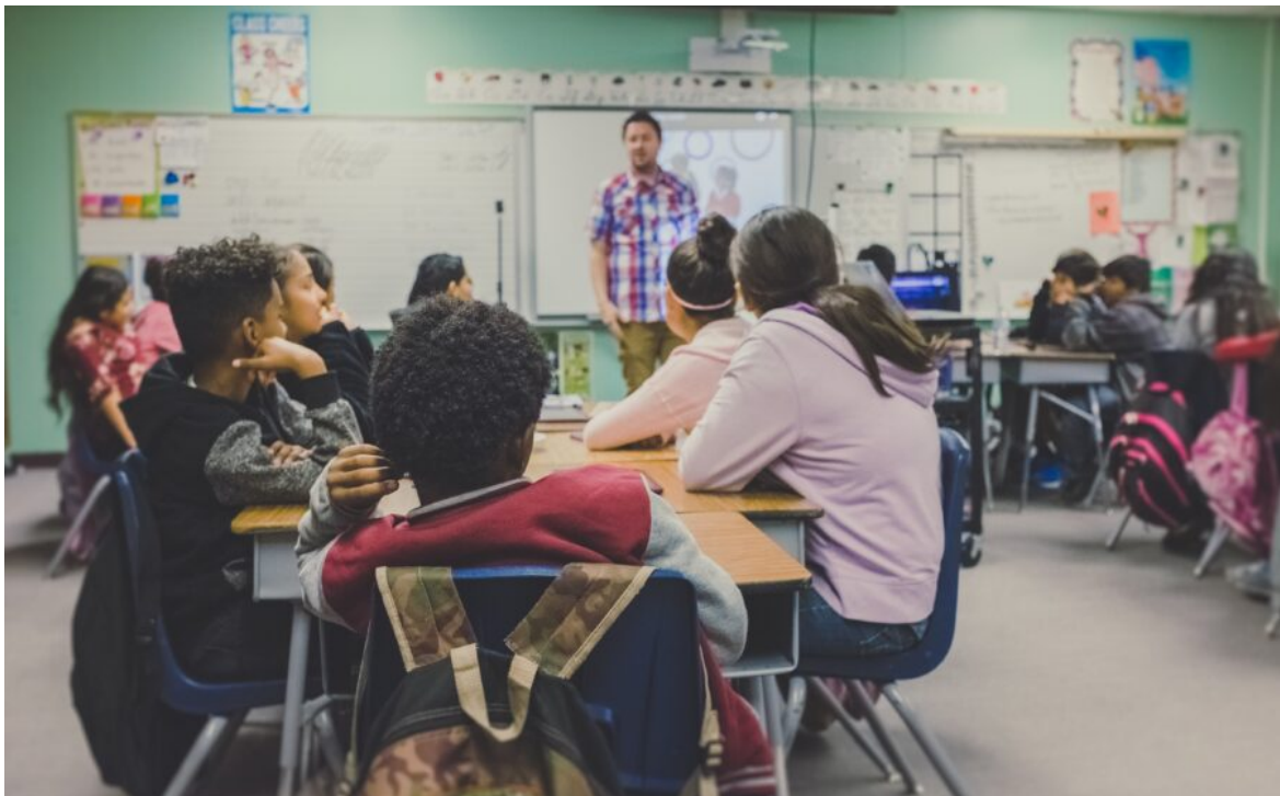
Abbildung 1, Symbolbild

Der RISE-Podcast zu Identität, Pluralismus und Extremismus