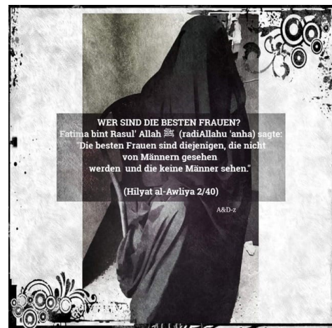
Abbildung 2, Beispiel für den Versuch, die Geschlechtertrennung und Verhüllung von Frauen als einzig islamisch korrekte Art der Lebensführung darzustellen, Quelle: Facebook

Themen können z.B. die aus ihrer Sicht einzig islamisch korrekte Kleidung muslimischer Frauen, die gottgegebene Rolle der Muslimin als Hausfrau und Mutter oder die vermeintlichen Vorteile einer islamischen Mehrehe sein. Um den besonderen Stellenwert der Frau im Islam zu betonen, bezeichnen sie muslimische Frauen oft als „Herrin des Haushalts“, welche die Familie umsorgt und die Gemeinschaft der Muslim*innen im Glauben stärkt. Plurale Entwürfe von Geschlecht oder anderweitige Lebensentwürfe setzen sie dagegen zugunsten traditioneller Geschlechterbilder herab. Ihre klaren Statements zu Wertvorstellungen und Rollenverteilungen bieten schnelle und einfache Antworten und vermitteln Halt.