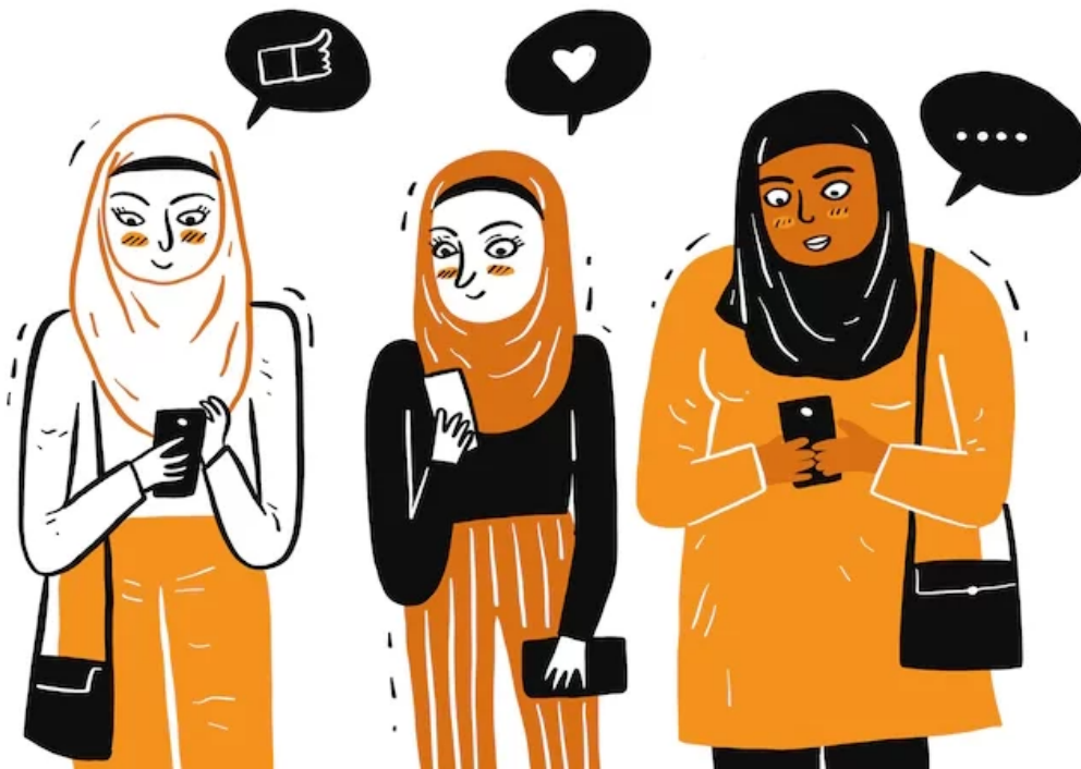
Abbildung 1, Symbolbild: Muslimische Frauengruppe in sozialen Medien

Die Verhandlung religiöser Normsetzungen am Beispiel einer Facebook-Gruppe