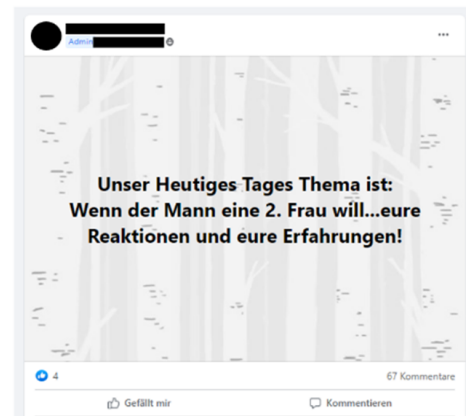
Abbildung 3, Beispiel einer abendlichen Diskussionsrunde der Facebookgruppe