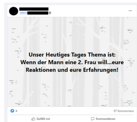
Abbildung 3, Beispiel einer abendlichen Diskussionsrunde der Facebookgruppe